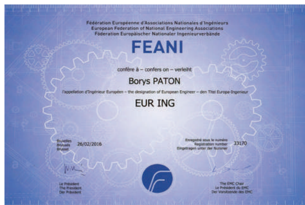
Рис. 2. Зовнішній вигляд диплома EUR ING, виданого академіку Б.Є. Патону

Ініціатива № 2. Найвищий почесний європейський титул для інженерів EUR ING. Критерії одержання Європейського паспорта інженера досить формальні — претенденту достатньо мати відповідну технічну освіту та стаж роботи за фахом не менше трьох років. Критерії для одержання диплома EUR ING значно жорсткіші. Крім підтвердження рівня своєї освіти, аплікант повинен написати стислий “твір” про свою професійну роботу, в якому аргументовано продемонструвати володіння інженерними навичками. Аплікація доповнюється копіями виконаних з участю заявника технічних проектів. Дуже приємно повідомити, що перша аплікація з України одержала позитивну оцінку від FEANI. Першим отримав найвищий почесний європейський титул для інженерів академік Б.Є. Патон ( рис. 2 ).