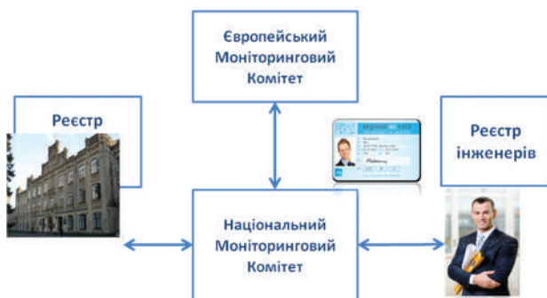
Рис. 3. Процедура одержання європейських сертифікатів і включення інженерних програм до реєстру FEANI INDEX (схема)

Процедура отримання для всіх трьох перелічених вище документів є однаковою. Вона представлена на рис. 3 і зовні нагадує процедуру захисту дисертації. На першому етапі аплікант подає заяву до Національного моніторингового комітету (НМК). На засіданні НМК відповідна заява розглядається та приймається, скажімо, позитивне рішення. НМК є своєрідним аналогом Спеціалізованої ради із захисту дисертацій. Після розгляду в НМК документи відправляються в Брюссель до ЄМК, який є аналогом ВАКУ. В разі