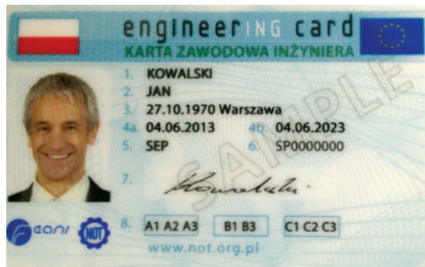
Рис. 1. Зовнішній вигляд зразка Європейського паспорта інженера

Ініціатива № 1. Європейський паспорт інженера. Це своєрідний аналог Болонської системи для працюючих. Європейська комісія ініціювала програму “Мобільність”, яка має на меті поліпшити умови руху висококваліфікованої робочої сили всередині ЄС. Зокрема, планується створення єдиного державного документа для певних категорій працівників. Перш ніж упровадити такий професійний паспорт, як державний документ він тестується в кількох країнах за підтримки громадських об'єднань. Зокрема, паспорт інженера створюється відповідно до розробок FEANI. Зараз ця система тестується в 13 країнах Європи. Україна першою з країн поза межами ЄС одержала від FEANI право на випуск цього документа (зрозуміло, в тестовому режимі). Планувалося, що паспорт інженера буде впроваджений як державний до-