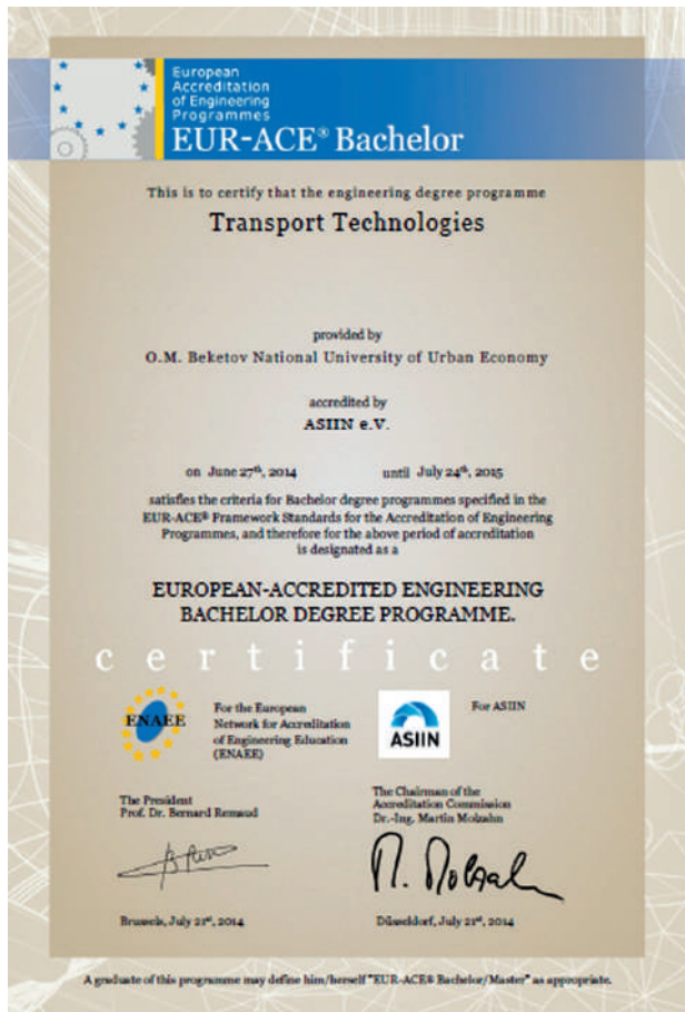
Рис. 5. Копія сертифіката EUR-ACE® (рівень “Бакалавр”), виданого українській програмі “Транспортні технології” з Харківського національного університету міського господарства ім. О.М. Бекетова