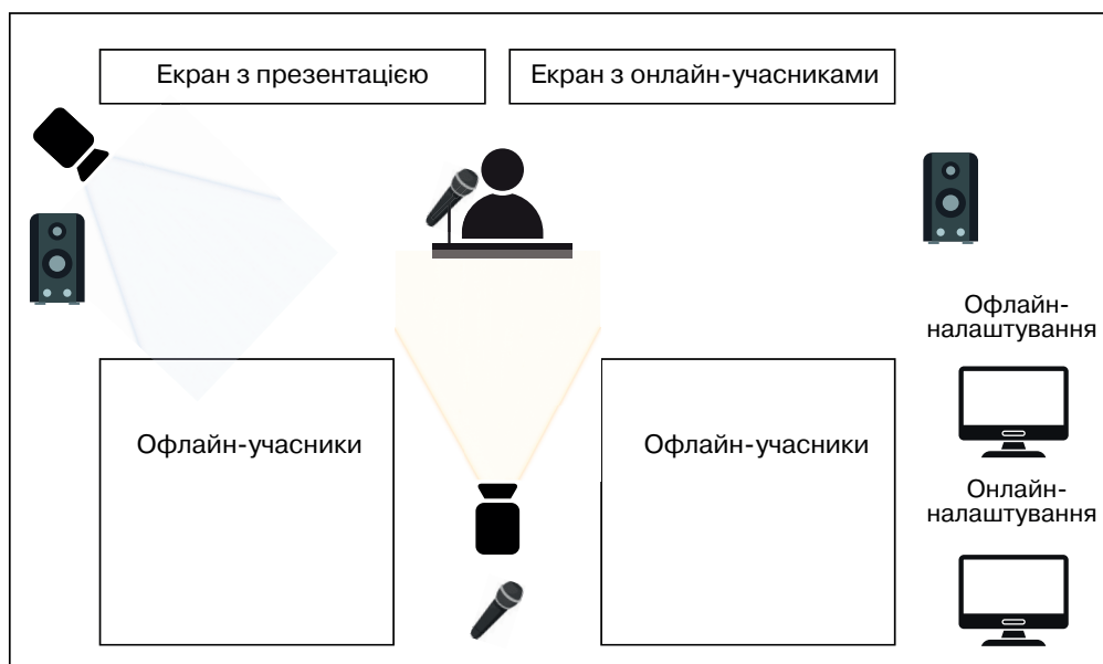
Рис. 1. Схема технічного оснащення приміщення для гібридної конференції

На рисунку 1 представлено базову схему технічного оснащення приміщення для проведення гібридної конференції. Вона демонструє мінімальний набір обладнання, необхідний для забезпечення якісного аудіо- та відеозв’язку між офлайн- і онлайн-учасниками.