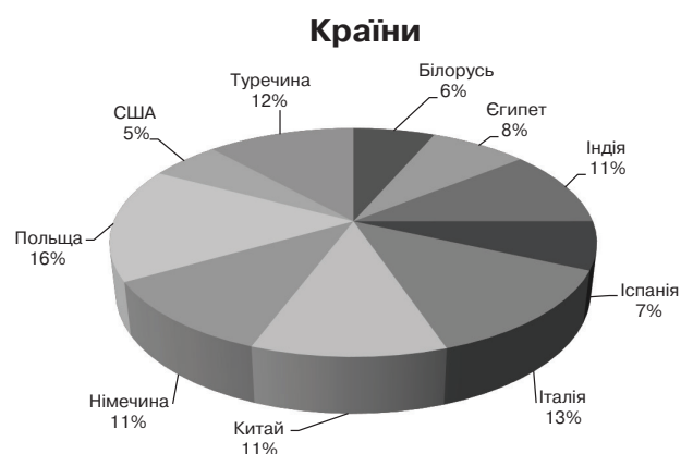
Рис. 1. Географічна структура зовнішньої торгівлі товарами у 2017 р.

Статистичні дані, представлені Державною службою статистики України, дають можливість дійти висновку, що для формування зовнішнього сектору економіки й зміцнення експортного